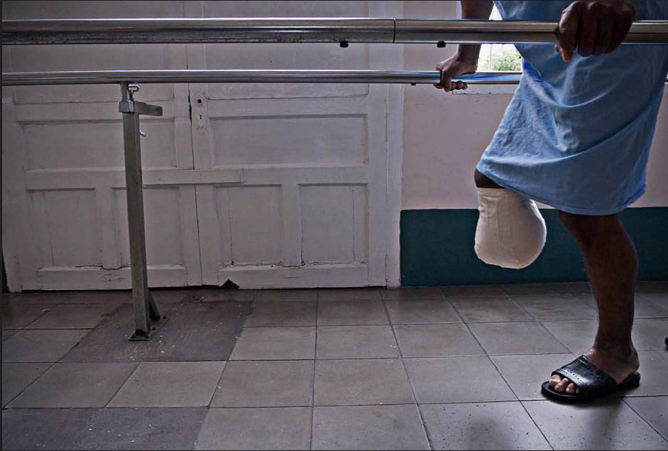
Crónica: Un país de mutilados, Antioquia, 2006.