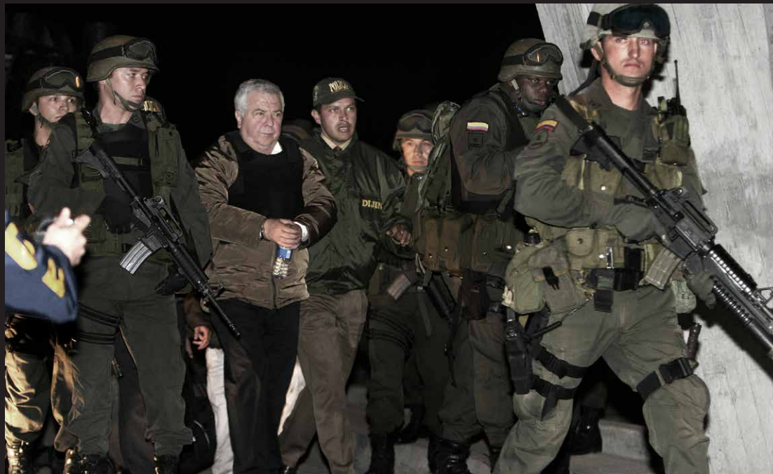
Extradición de Gilberto Rodríguez Orejuela a Estados Unidos, diciembre DE 2004, aeropuerto militar Catam.