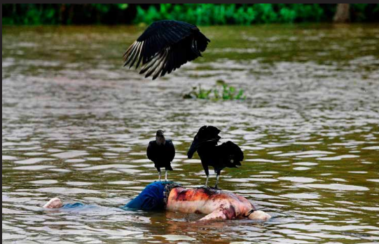
Río Atrato, cementerio flotante, mayo de 2002.