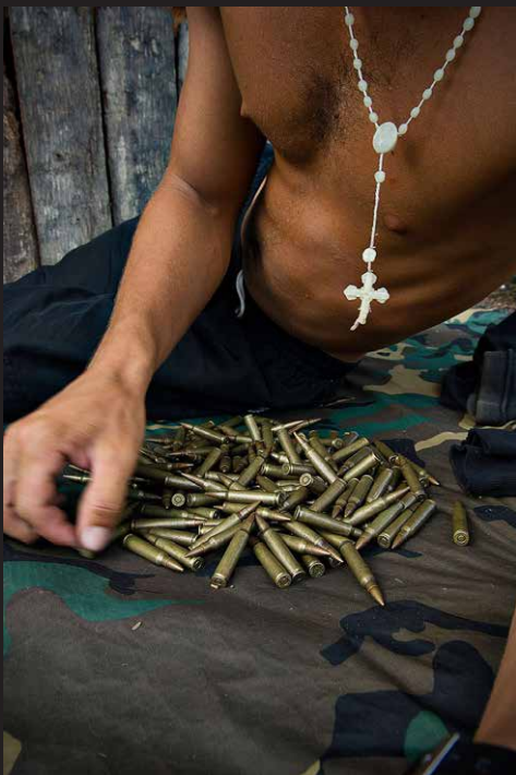
Crónica: Historia Humana de un bala. Operativo con el ejército desmantelando un laboratorio de coca, Tumaco, 2005.