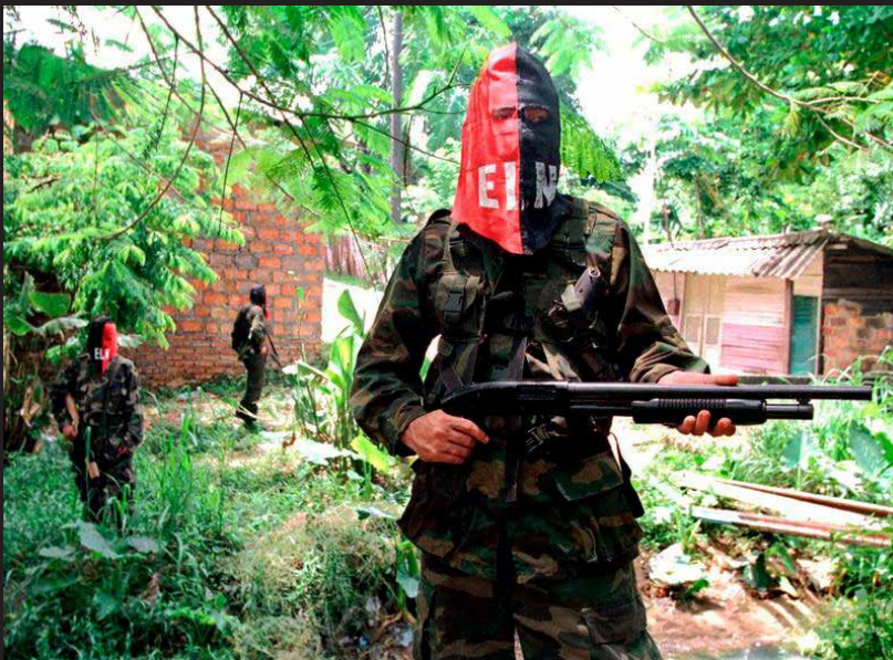
Guerrilleros del ELN en la zona urbana de Barrancabermeja, 1998.