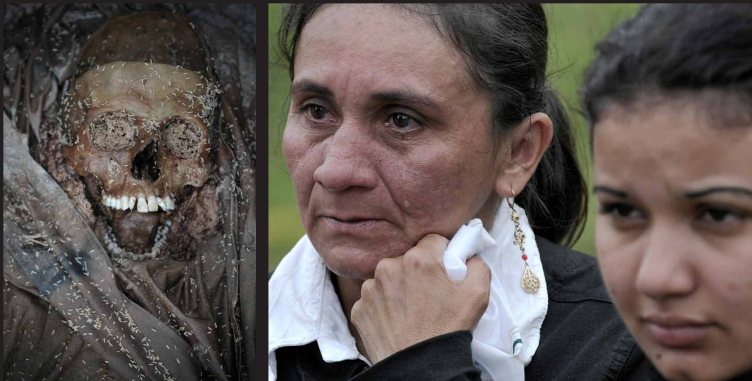
Trabajo forense en búsqueda de las ejecuciones extrajudiciales, mal llamados falsos positivos.