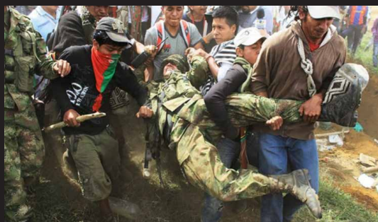
Indígenas Nasa cargan a un soldado durante un ataque a un grupo de soldados que protegían una torre de comunicaciones en Toribio Cauca, Julio 17 de 2012.