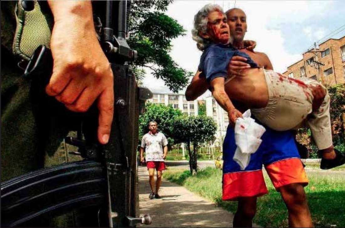
Operación Orión, 17 de octubre de 2002.