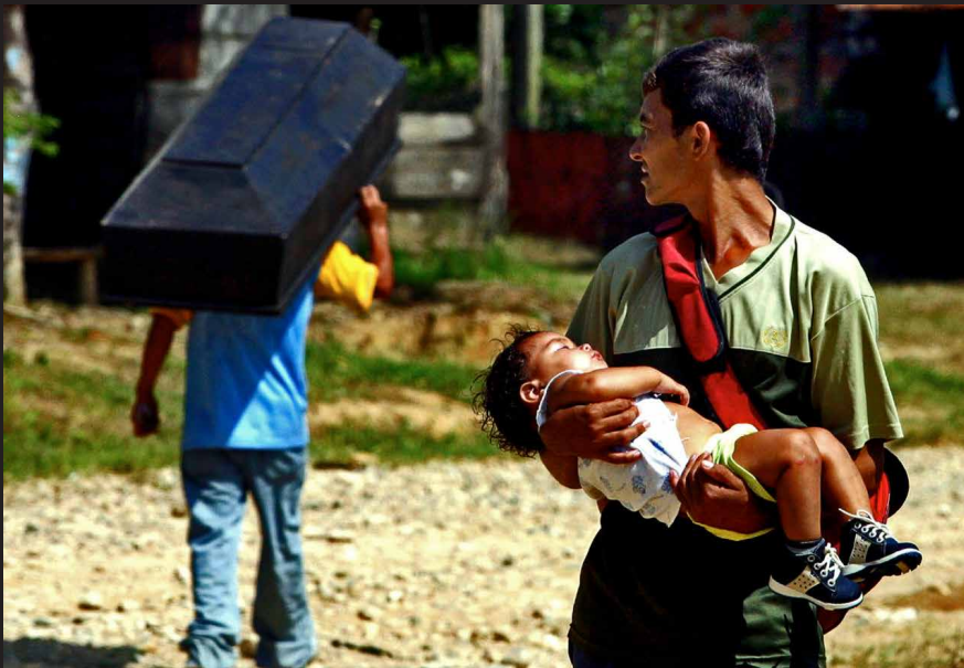
Escena captada días después de la masacre de La Gabarra, Norte de Santander, perpetuada por parte del Bloque Catatumbo de los paramilitares, 2004.