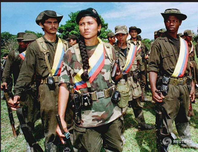
Campamento frente cuartro de las FARC después de la toma de Miraflores, Guaviare, 1998.