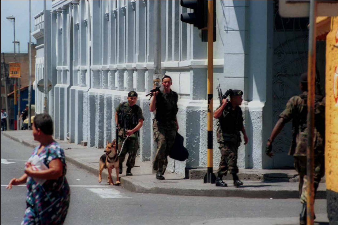
Guerrilleros de las FARC disfrazados de soldados, el 11 de abril de 2002, con el fin de llevar a cabo el secuestro de 12 diputados del Valle.