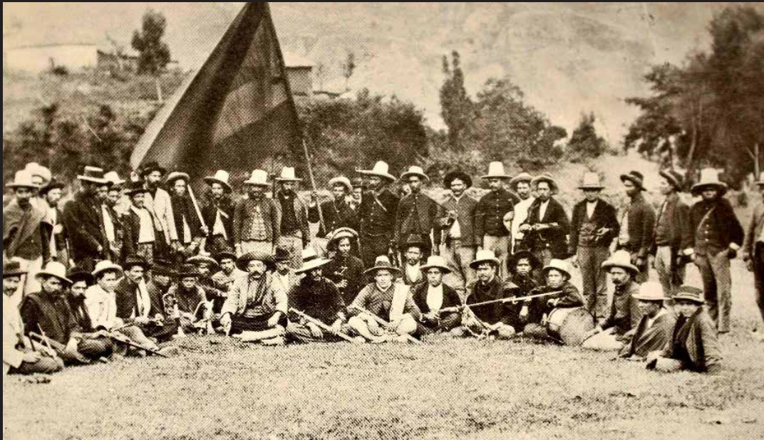
Guerra de los Mil Días.