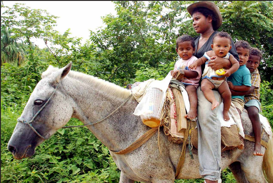
Masacre en el Nudo de Paramillo, Córdoba, por enfrentamientos entre paramilitares y guerrilla, 2004.