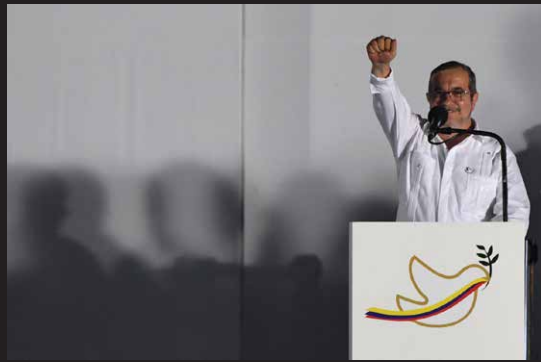
Firma del acuerdo de paz en Cartagena el 26 de septiembre de 2016.