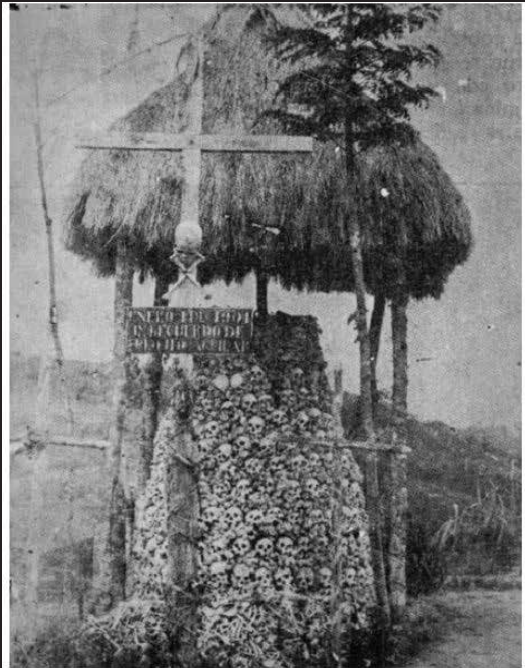
ENERO DEL 1901 – EN RECUERDO DE ..... AGUILAR – Osario de Palonegro, cementerio de Bucaramanga, con cráneos de las víctimas sin identificar tras la Batalla en 1900. Fotografía de Amalia Ramírez de Ordoñez, de enero de 1901