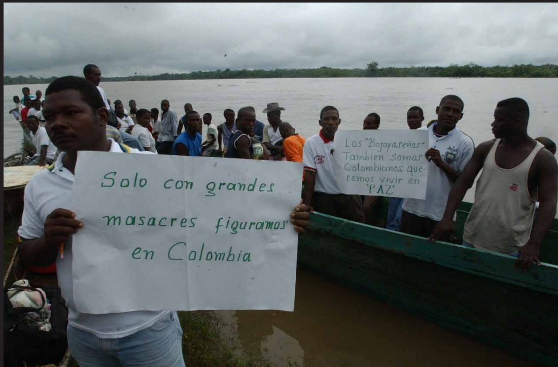
Foto posterior a la masacre de Bojayá el 2 de Mayo 2002.