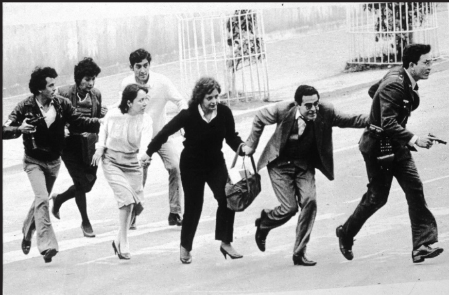
Toma y retoma del Palacio de Justicia, 1985.