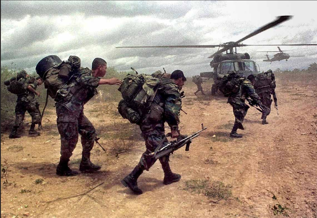
Soldados se preparan para combatir a las FARC luego del rompimiento de las negociaciones de paz del Caguán en la presidencia de Andrés Pastrana, 7 de enero de 1999.