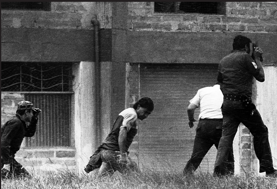
Extradición de Carlos Lehder, 1987.