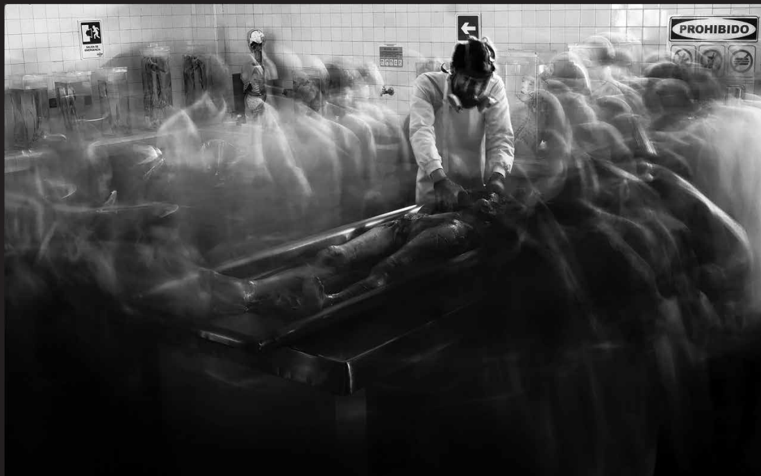
Jóvenes que embellecen cadáveres. Un grupo de estudiantes de tanatopraxia y criminalística hacen sus prácticas con cadáveres no identificados que fueron donados a la ciencia, 2017.