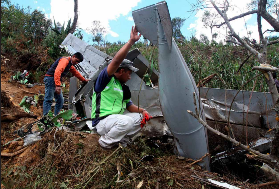
Avión Tucano accidentado en Jambaló, Cauca, 2012.