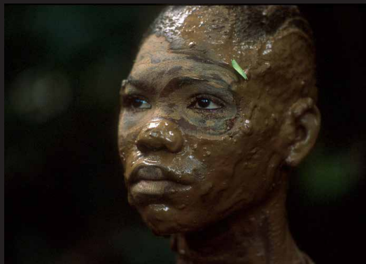
Escuelas de guerra para entrenar a jóvenes reclutas del bloque paramilitar Elmer Cárdenas para combatir a las FARC, en el departamento del Chocó días después de la masacre de Bojayá. Selvas del Darién, 2002.