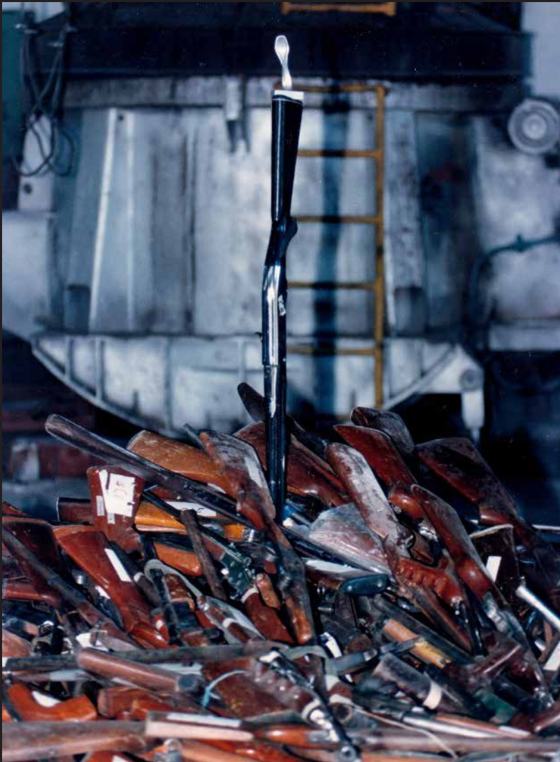
Fundición de armas del M19, compromiso de la firma del acuerdo de paz. Fecha de fundición: 1990.