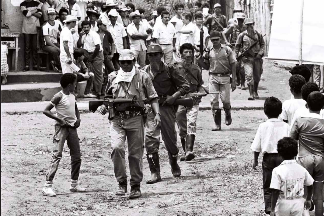
Desmovilización de 200 guerrilleros del PRT (Partido Revolucionario de los Trabajadores) en La Haya, corregimiento de San Juan, Nepomuceno, departamento de Bolívar, 1991.