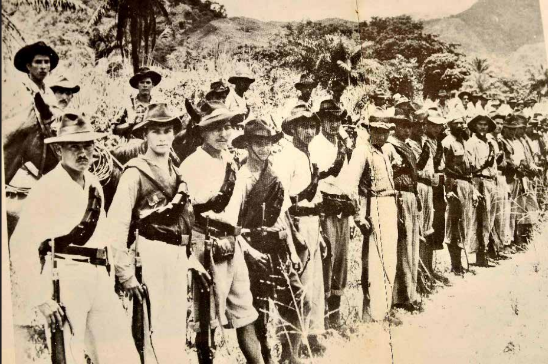
Guerrilla de Guadalupe Salcedo.