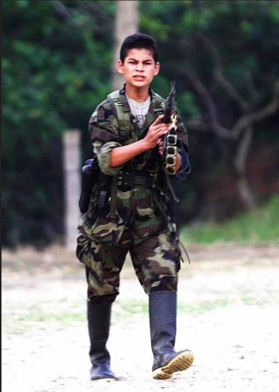
Joven guerrillero cerca de Pajjil, Caquetá durante un retén de las Farc. Él apunta con su arma a la prensa al ver que se estaba desatando el retén que ellos habían armado. febrero 21 de 2002