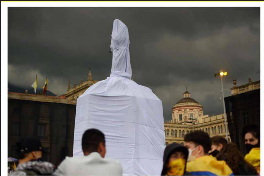
Plaza de Bolívar, Bogotá.