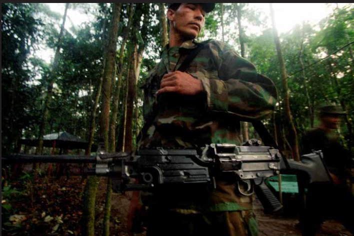
Guerrillero de las FARC porta un arma de alto calibre de lo que ellos denominan “recuperados”, tras la muerte de un soldado del ejército, (nótese el disparo en el centro del arma). Montañas del Meta, 4 de abril de 2011.