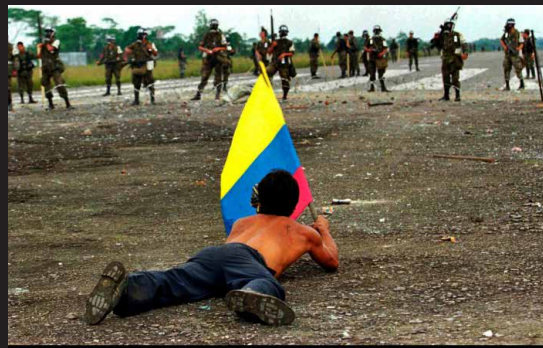
Marchas campesinas, Putumayo, 2002.