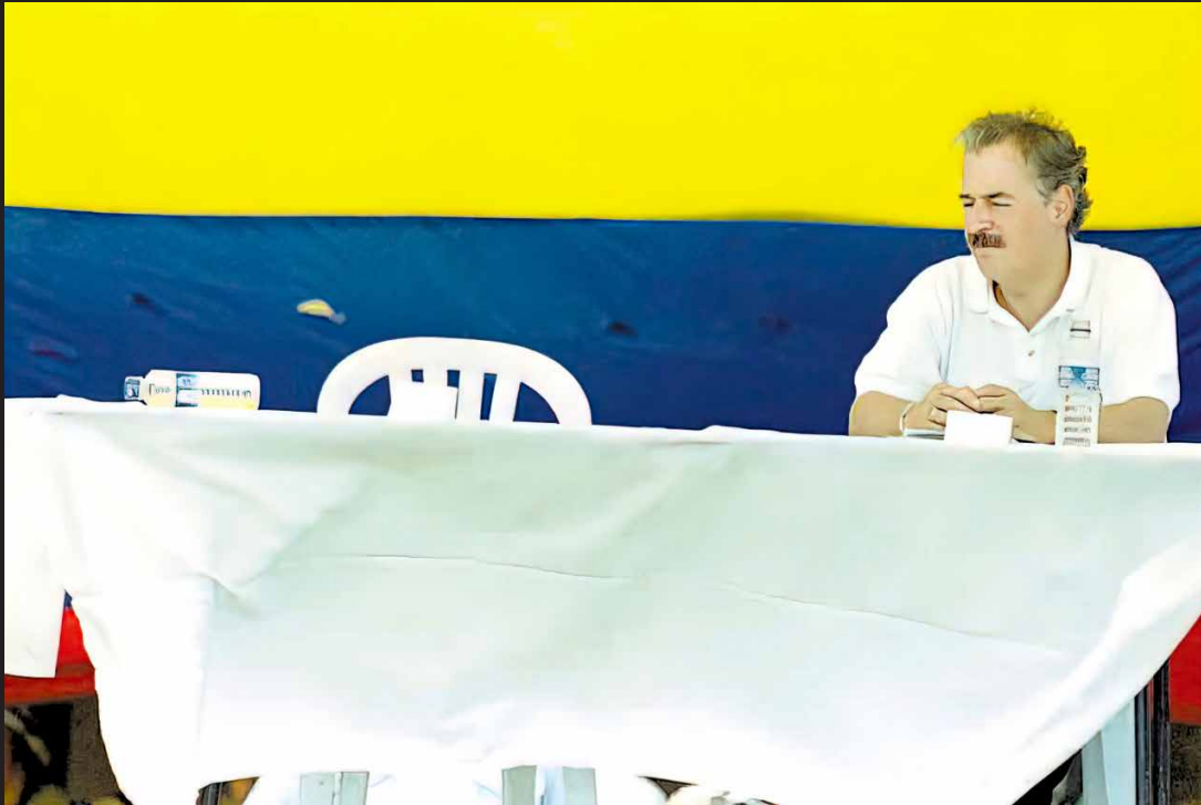
La silla vacía, cuando el líder máximo de las FARC, Manuel Marulanda Vélez alias Tirofijo, no se presentó a la firma del acuerdo de paz con el entonces presidente Andrés Pastrana, 7 de enero de 1999.