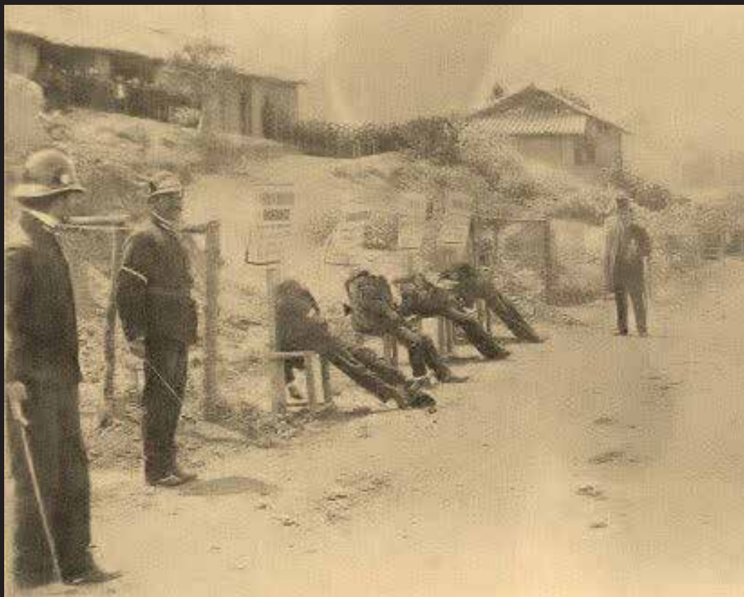
Fusilados por atentar contra el presidente Rafael Reyes.