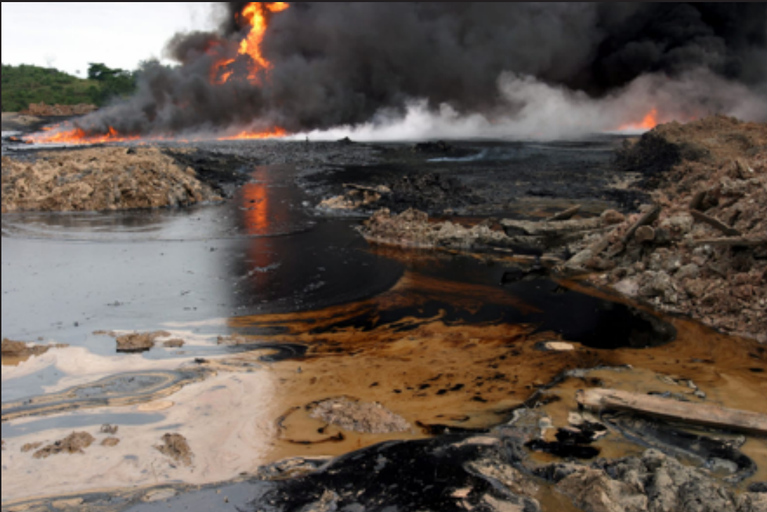
Derrame de petróleo luego del atentado de las FARC al oleoducto en Teteyé, Putumayo.