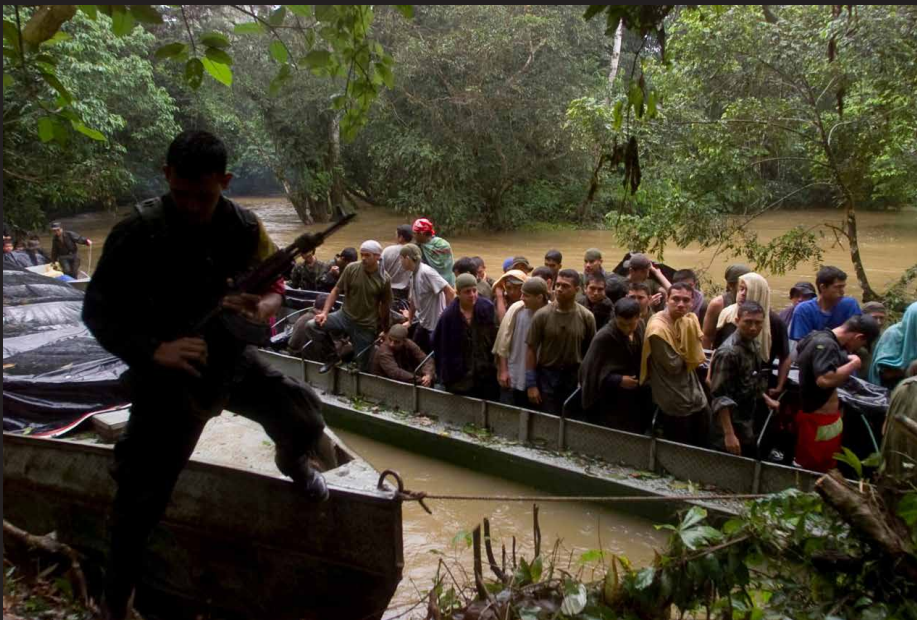
Liberación de 242 policías y militares secuestrados por parte de las FARC, como gesto para iniciar conversaciones con el gobierno de la época en las selvas de Caquetá. 28 de Junio 2001.