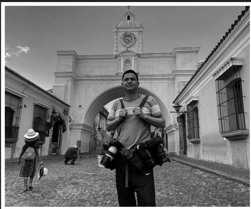
En homenaje a Héctor Fabio Zamora.