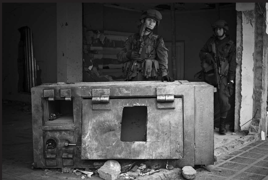
Policías custodian las antiguas instalaciones del Banco Agrario en Toribío, Cauca, 2012.