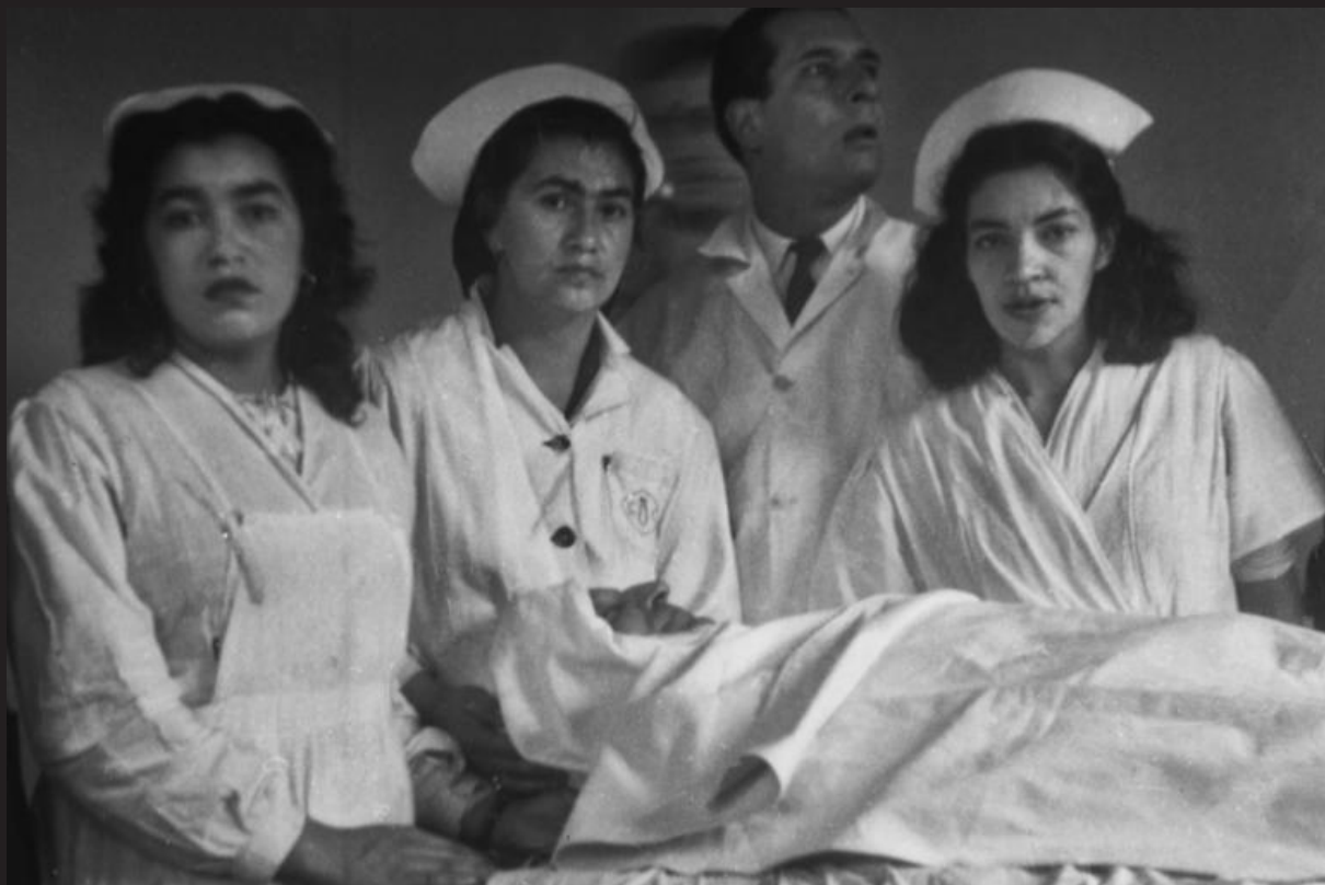
El Bogotazo, 9 de abril de 1948.