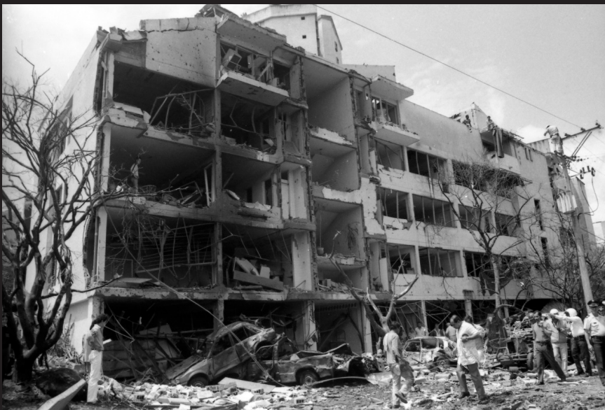
Explosión de carro bomba en el barrio Poblado de Medellín, dirigida a la estación de policía del sector, 1991.