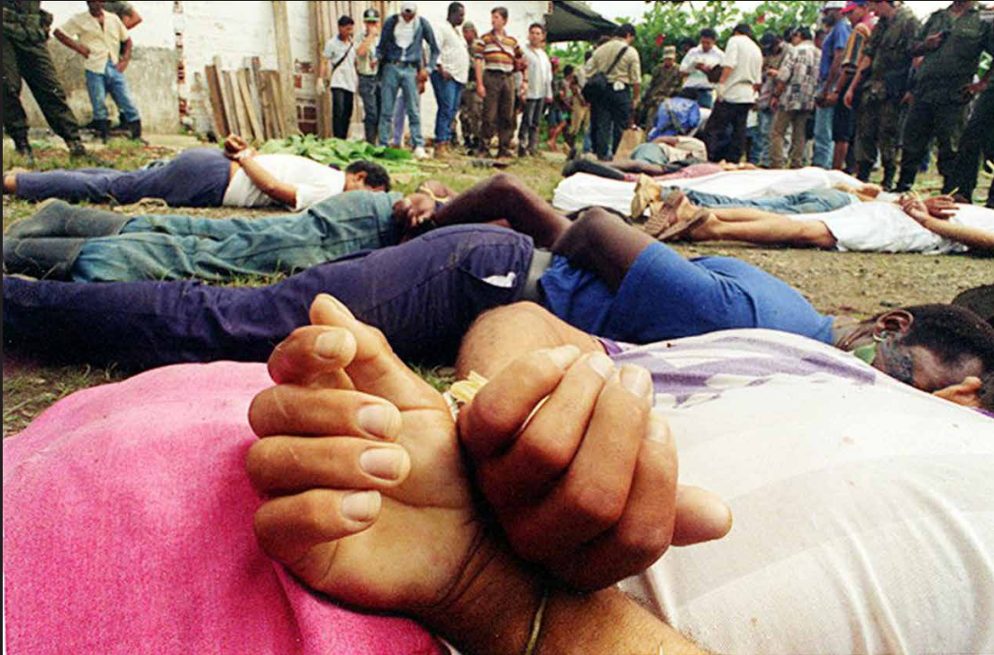
Masacre de los Kunas en Carepa, Antioquia, el 29 de agosto de 1995. Fueron masacrados 18 trabajadores bananeros por miembros del V frente de las FARC.