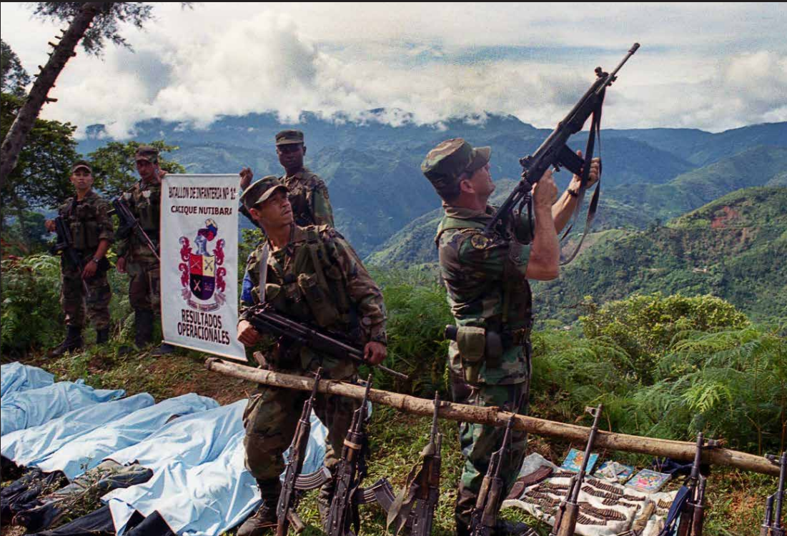
General Mario Montoya.