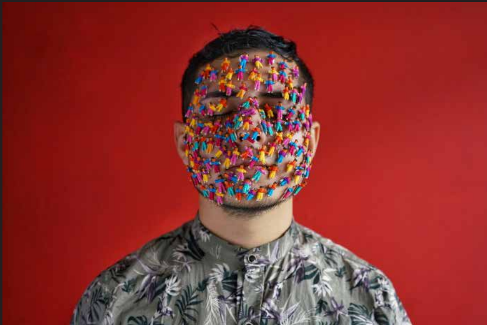
Joven líder de la Asociación de Víctimas de Desaparición forzada fue amenazado y exiliado en España. Fotografía de la serie “Entre el cielo y la tierra” proyecto que resignifica las luchas por las cuales han sido amenazados, exiliados y ejecutados los líderes sociales.