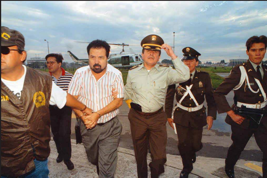
Captura de Gilberto Rodríguez Orejuela, 9 de junio de 1995.