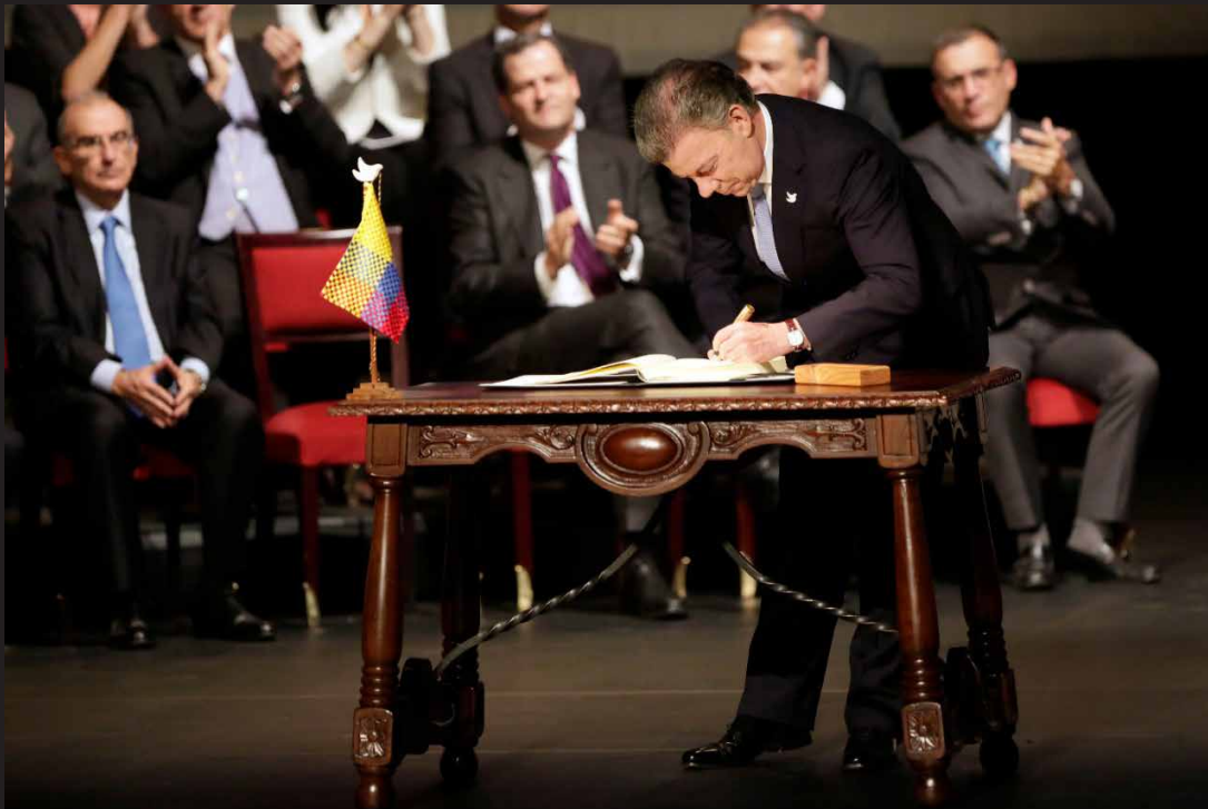
Teatro Colón, 24 de noviembre de 2016, Bogotá.