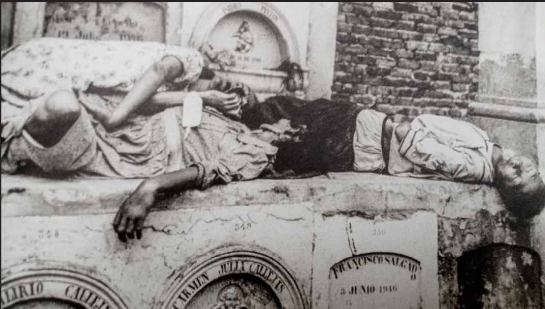
El Bogotazo, 9 de Abril de 1948.