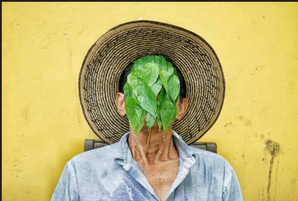
Líder de tierras de Bolívar que ha resistido pacíficamente por más de 30 años el asedio de Pablo Escobar, los paramilitares, la guerrilla, el gobierno y las palmicultoras.