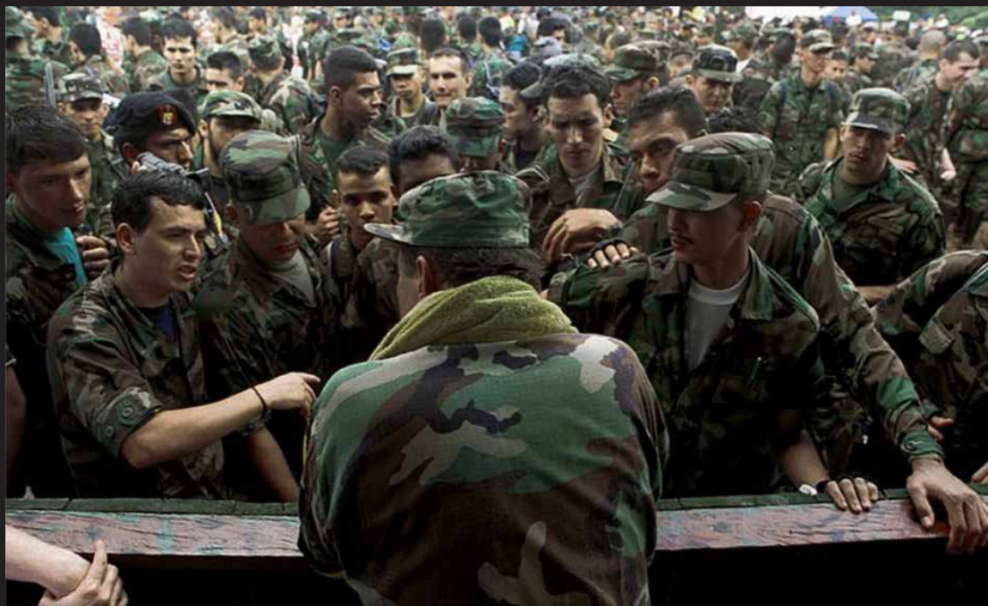
Un número de los 242 policías y militares secuestrados por las FARC antes de ser intercambiados por guerrilleros presos en las cárceles del país, dialogan con Manuel Marulanda, alias Tirofijo, máximo comandante del grupo en la Macarena, Meta, 28 de Junio de 2001.