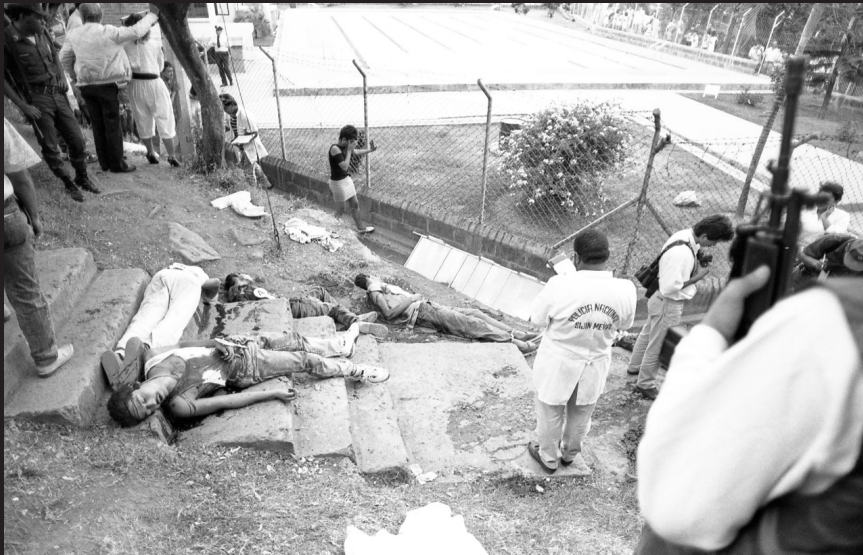
Jóvenes asesinados en el barrio Tricentenario a causa de la guerra desatada por parte de Pablo Escobar al gobierno, 1990.