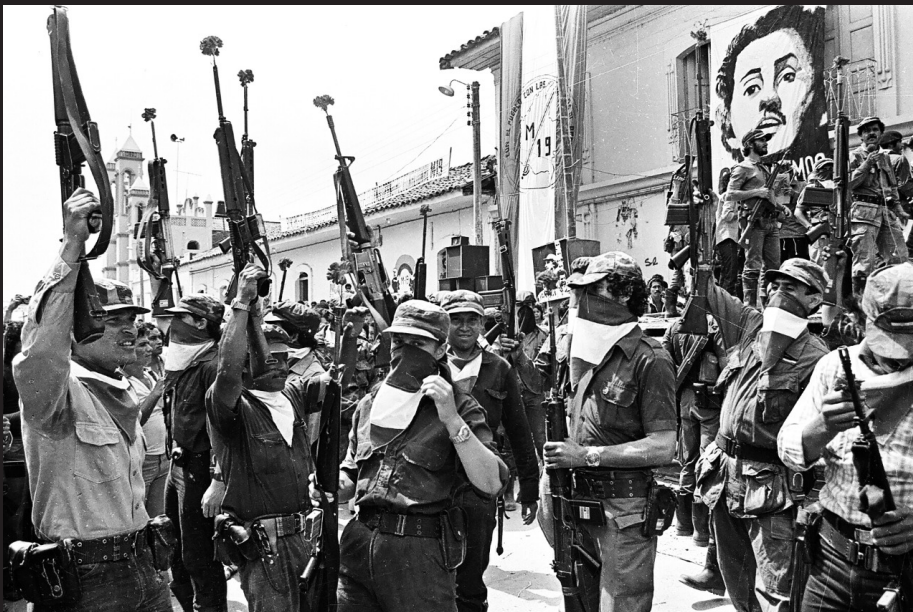
Armas alzadas del M19.