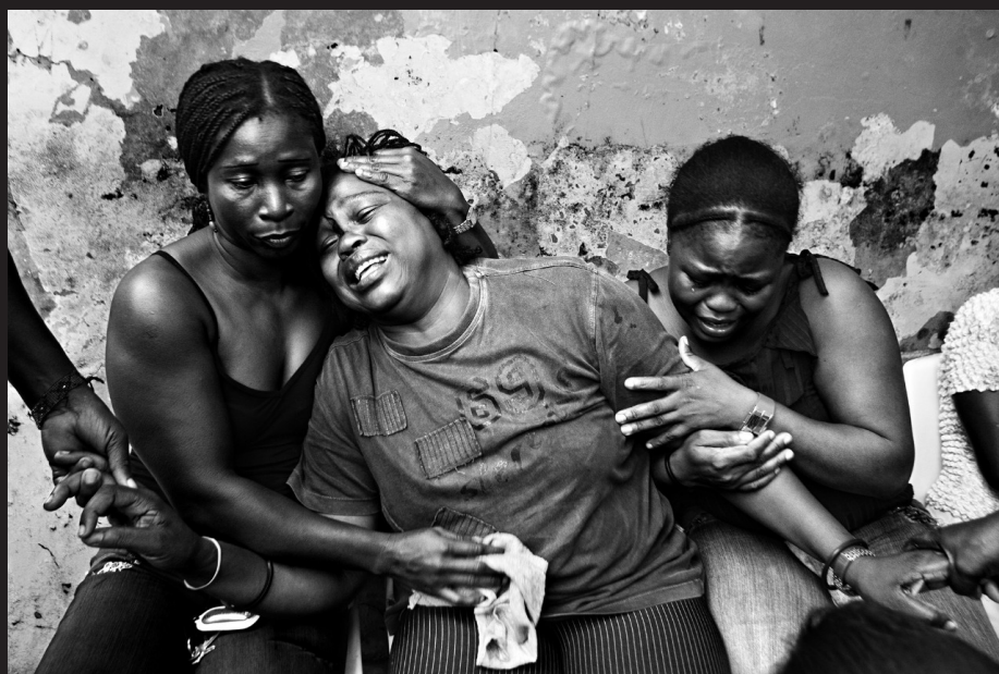
Familiares de los mineros asesinados en la masacre de Basurú, Chocó, se enteran de su muerte, Quibdó 2008.