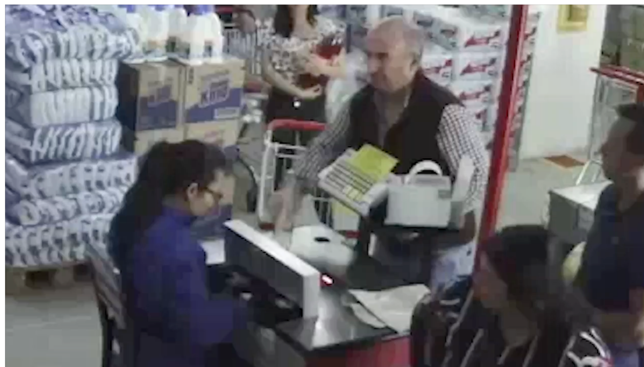
Video cámara de seguridad