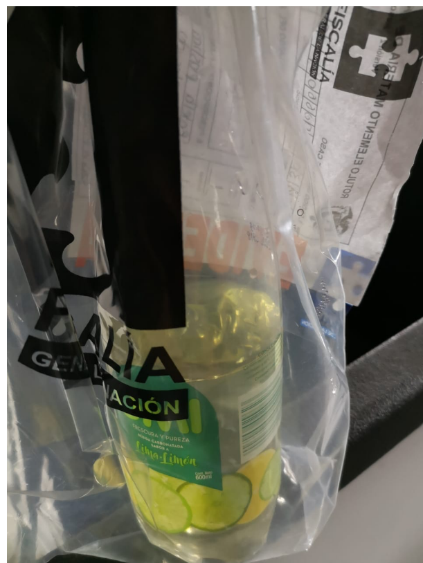
Cadena de custodia