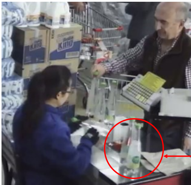
Compra del producto