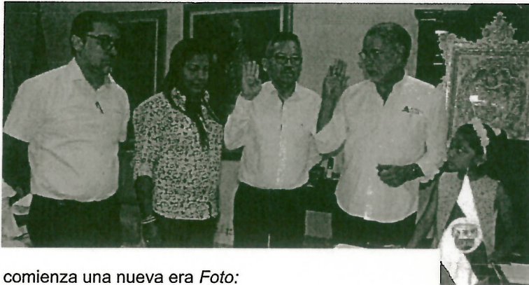
Universidad del Atlántico comienza una nueva era